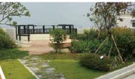
屋頂立體綠化