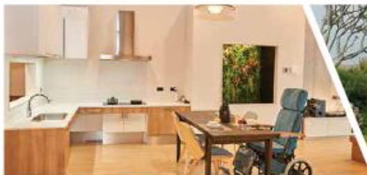
全齡化空間

國產或進口家具、寢具、辦公家具、一般家具；地毯、地墊、窗簾、壁紙、造型藝術燈飾、鏡子、贈飾品、掛畫及家飾配件...等。