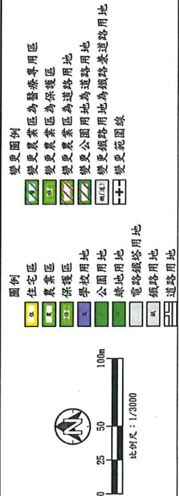
主要計畫變更內容示意圖