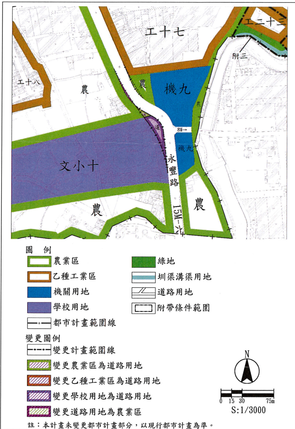
主要計畫變更位置示意圖