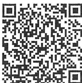
桃園市政府都市發展局 Youtube QRcode

本案說明會簡報、公展計畫書圖及陳情意見表，請掃描左方 QRcode 或至桃園市政府都市發展局網站 ( https://urdb.tycg.gov.tw/ ) 下載。