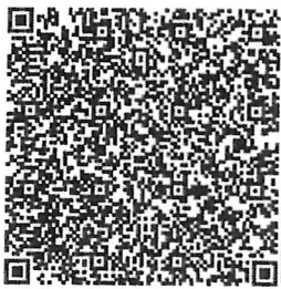
桃園市政府都市發展局 網站 QRcode