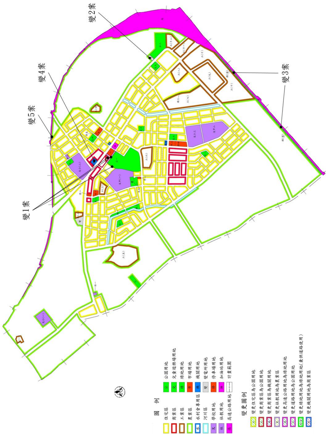
「變更蘆竹鄉(大竹地區)都市計畫(公共設施用地專案通盤檢討)案」變更示意圖