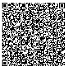
桃園市政府都市發展局 網站 QRcode