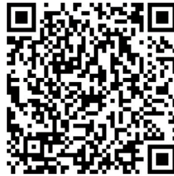
桃園市政府都市發展局 Youtube QRcode

本計畫公展草案內容及陳情意見表下載，請掃描左方 QRcode 或至桃園市政府都市發展局網站，網址： https://urdb.tycg.gov.tw/ 。