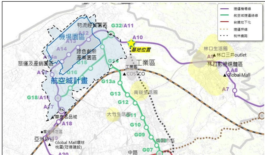
圖 1：本案基地位置圖