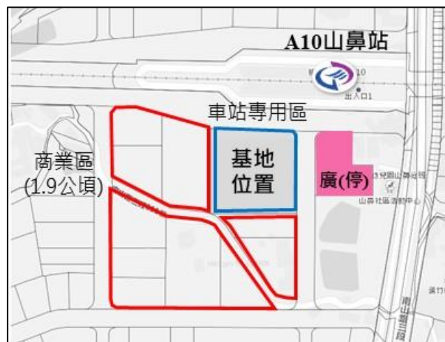
圖 2：本案基地使用分區圖