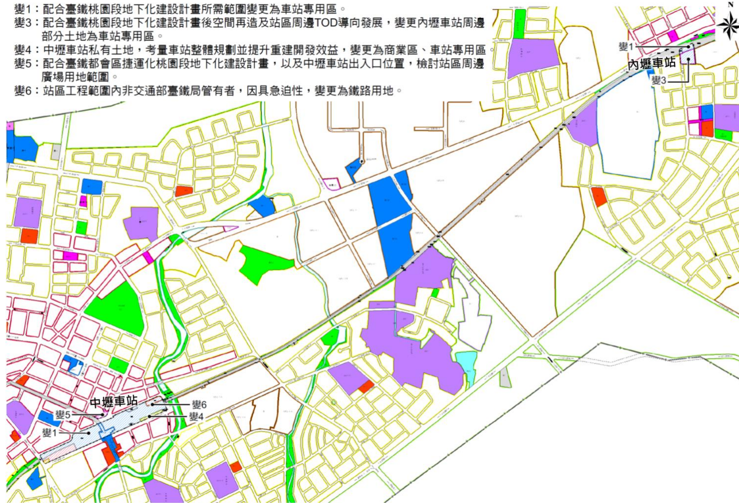
內壢站及中壢站變更位置及內容示意圖