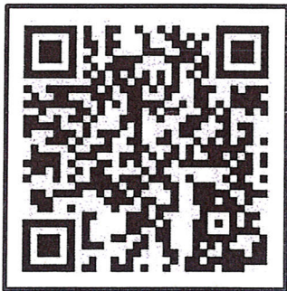
桃園市政府都市發展局 網站 QRcode

各公民或團體對計畫案如有任何意見，請利用說明會場所提供之意見表，於公開展覽期間以書面載明姓名或名稱、地址及建議事項，向本府都市發展局及龍潭區公所提出 (陳情意見表於本府都市發展局都市計畫科索取，或至本府都市發展局網站下載)。如有疑義，歡迎電洽本府都市發展局都市計畫科 (03-3322101#5224 謝小姐)。